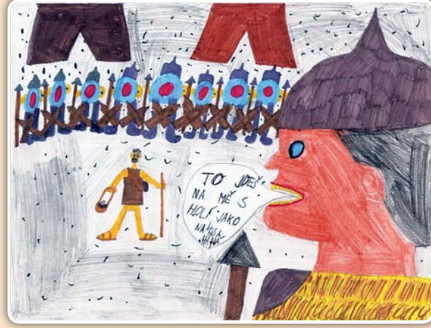
Radim Baláž, 9 let